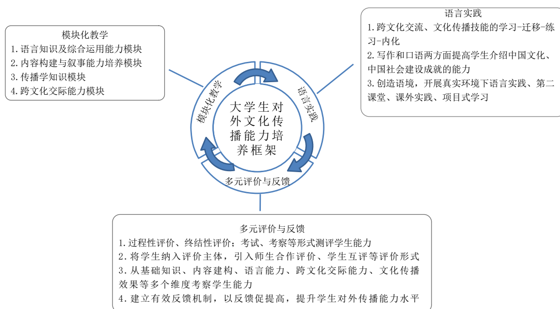
Figure 2. Structure of cultivating college students' ability to spread culture abroad

受现实条件限制,我国高校专业性对外传播人才培养数量有限,与国家软实力建设需求尚有一定差距。而近年开展的新文科建设提倡不同学科交叉发展、协同育人,其理念为培养“一专多能”兼具对外传播素养的复合型人才提供新契机。大学英语教学目标与对外传播能力培养目标有一定共通性:就教学内容而言,两者都利用文本内容学习和积累语言知识和人文知识;就能力培养而言,两者都是为了满足沟通交流的语言需求,兼具人文性和工具性双重属性。将对外传播能力培养以模块化教学的形式融入大学英语教学体系,以多样性语言实践夯实能力基础、以多元化教学评价把控学习质量,及时发现问题、查漏补缺;以“学习-实践-评价-反馈”联动的教学格局提升学生综合语言能力,补齐学生对外传播能力不足的短板,实现对外传播能力培养目标。(见图2)